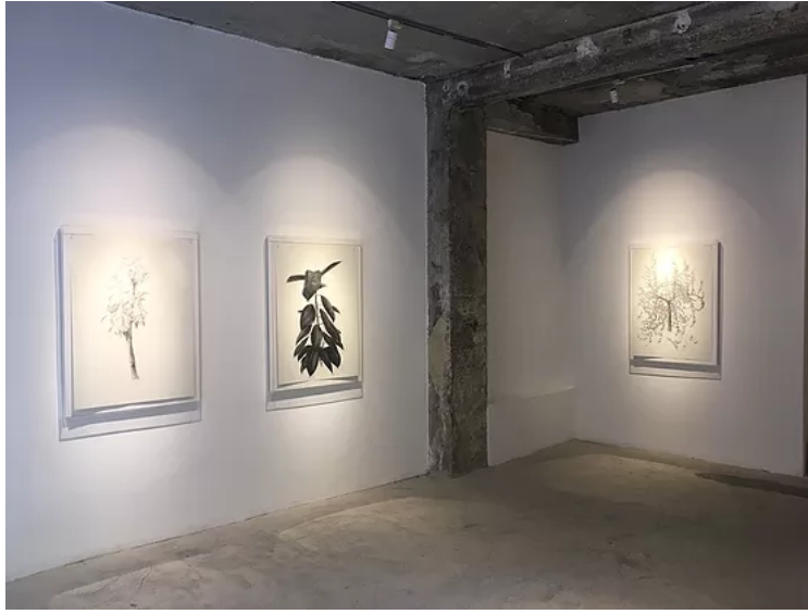
Büyük Çayır sergi görüntüsü