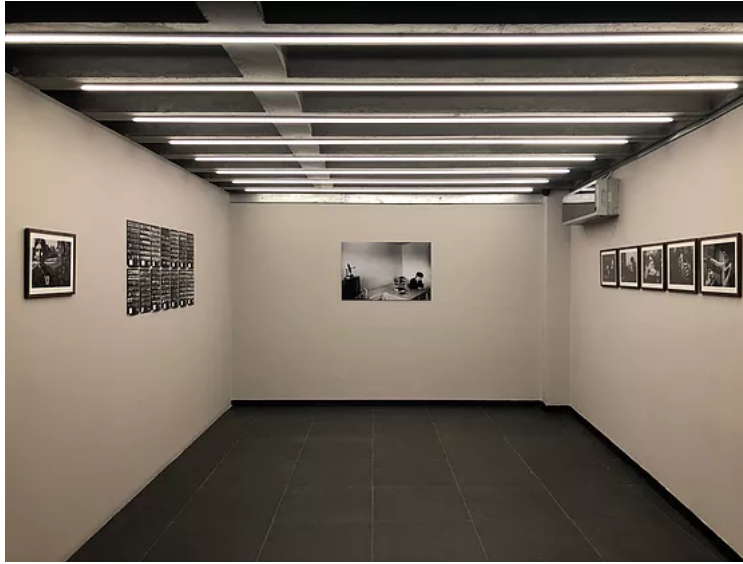
Büyük Çayır sergi görüntüsü