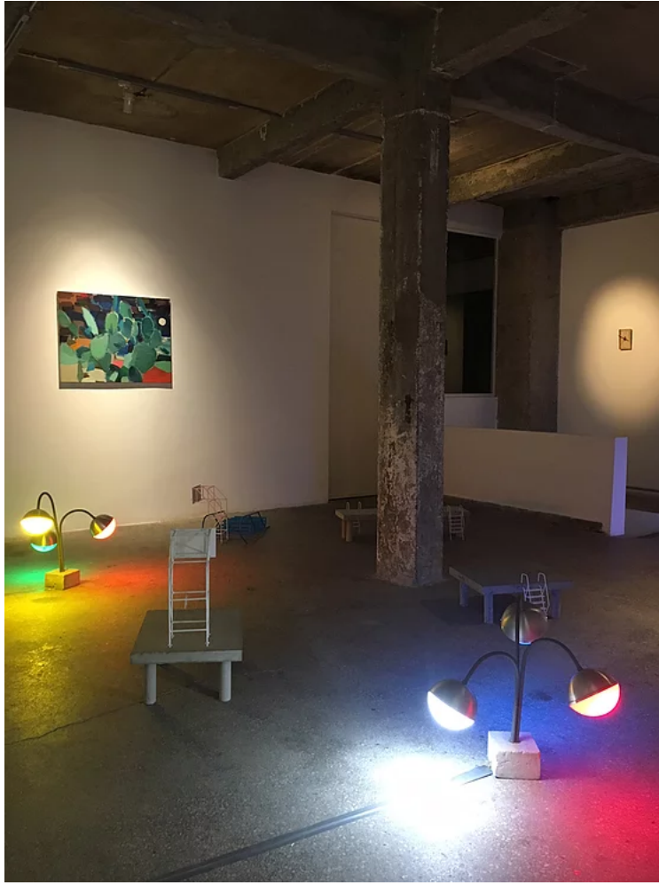
Büyük Çayır sergi mekanlarından Aykut&Öktem Galerisi'nden sergi görüntüsü