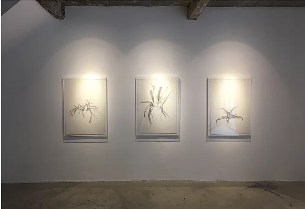
Büyük Çayır sergi görüntüsü