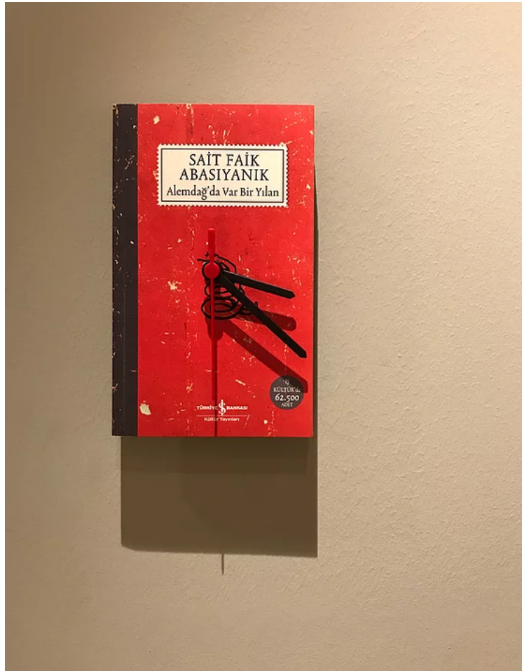
Sarkis, Büyük Çayır için 12 Saat, Ed. 4+2, 2018